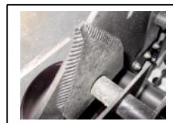
Kétél -Leng kés